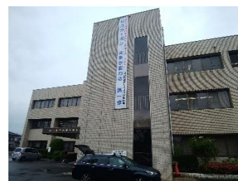
山口総合庁舎の懸垂幕