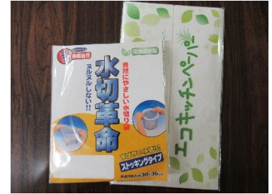
普及啓発資料 (水切り袋、キッチンペーパー)

ウ 水切り袋、キッチンペーパー、エコスポンジ、紙ストロー、エコバックを配布・作成 [1,701個 配布、1,400個 作成]